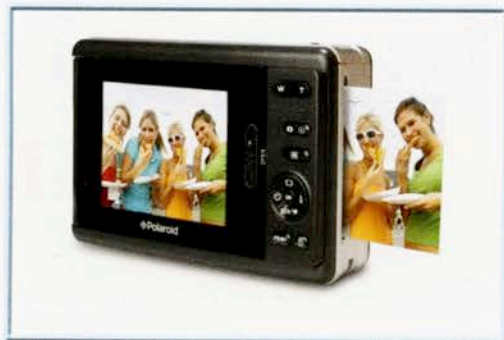
Câmera digital Polaroid PoGo

O coração dessa tecnologia é o papel da Zink. No substrato estão contidos cristais de corantes amarelo, ciano e magenta e sobre estes há uma camada protetora de polímero. Os cristais são incolores antes da impressão, portanto o papel Zink se parece com um papel fotográfico branco comum. Quando uma impressora térmica ativa os cristais, estes conseguem formar as cores. Isso simplifica tremendamente o processo de impressão, eliminando cartuchos, dutos e controles.